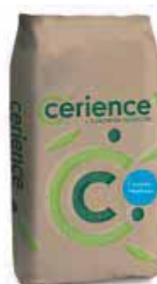
Conditionnement : Sac de 25kg